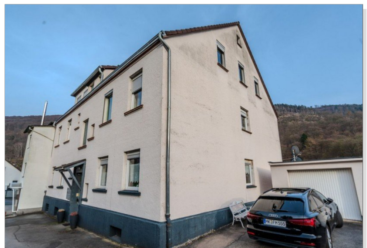
03. Ansicht von Rechts