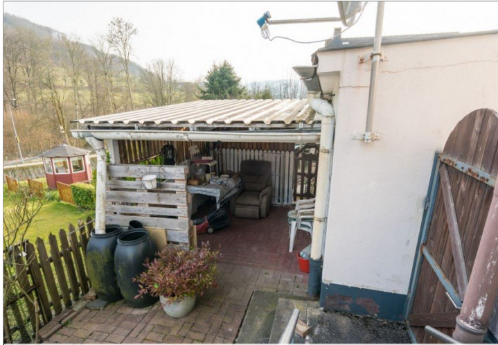
05. Überdachte Terrasse