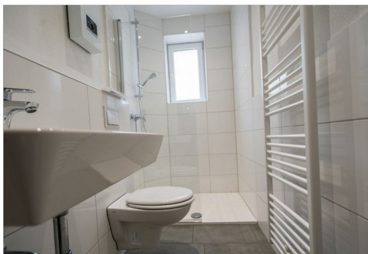
13. Badezimmer mit Dusche