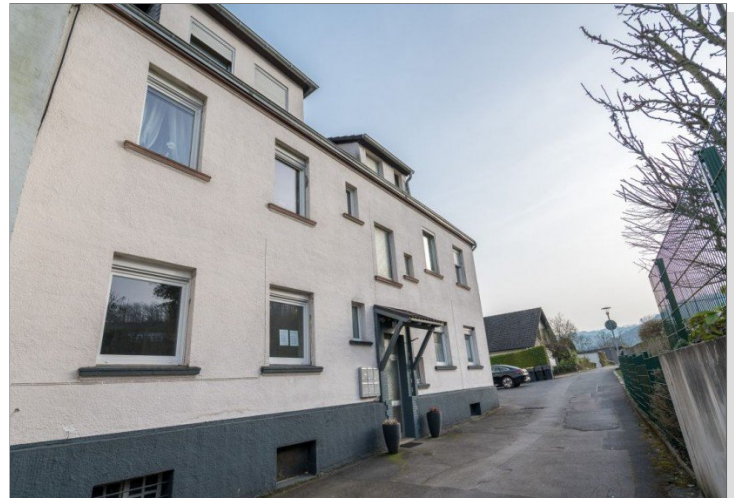
02. Ansicht von Links