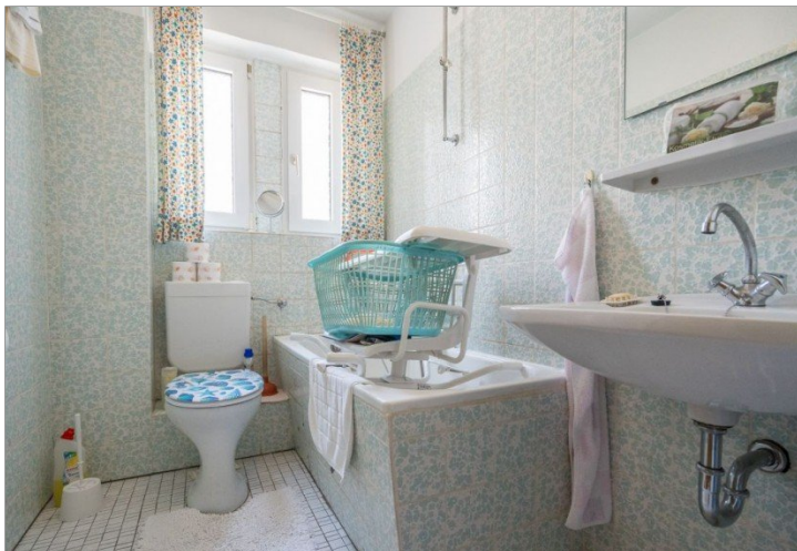
23. Badezimmer 10G