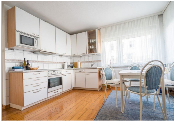
16. Kueche EG