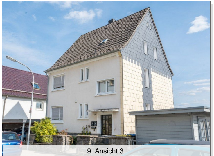
9. Ansicht 3