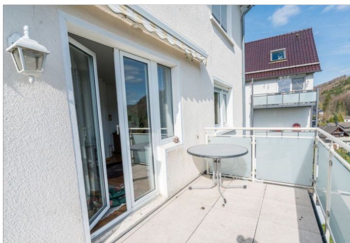
18. Balkon EG