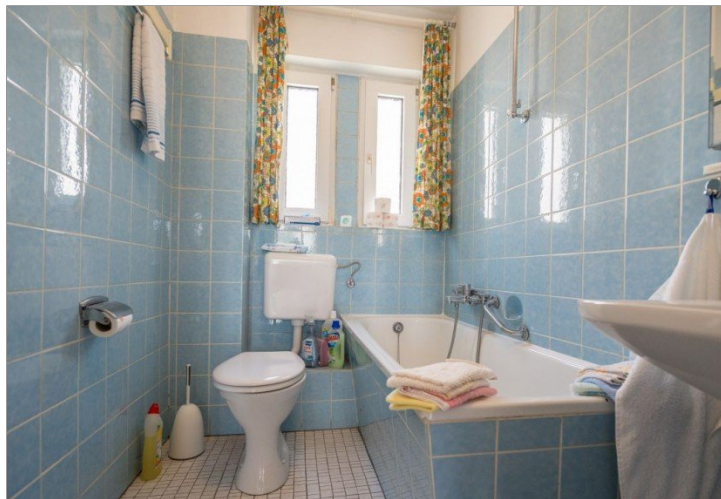
17. Badezimmer EG