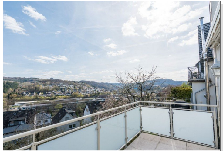
19. Balkon EG