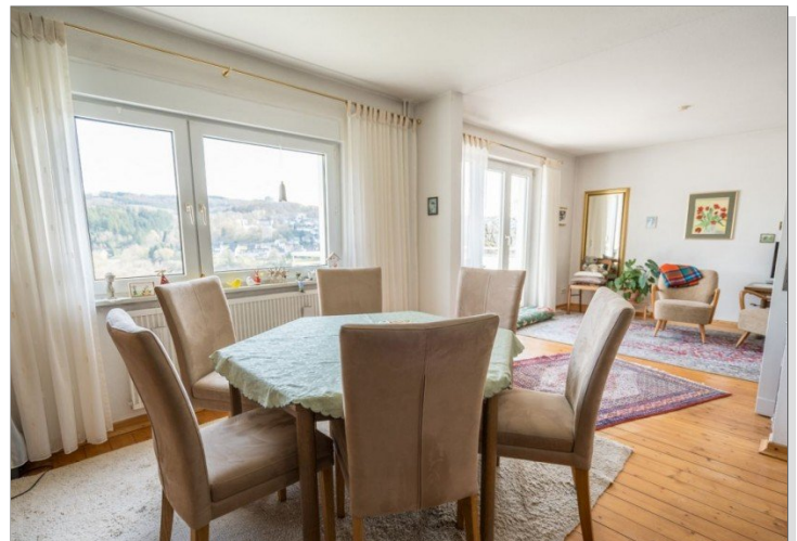
14. Großes Wohnzimmer mit Essbereich