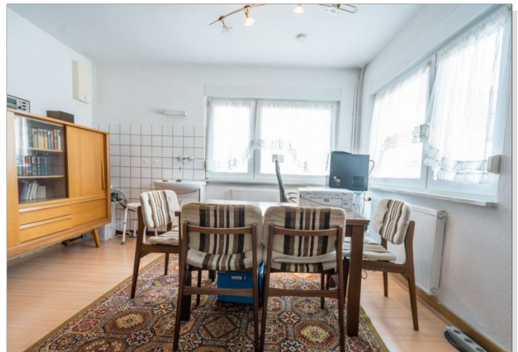
20. Kueche 1OG