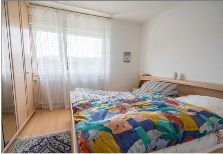
22. Schlafzimmer 10G