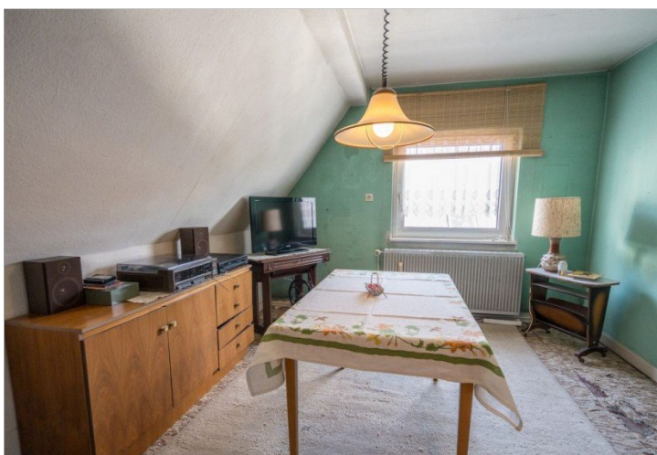
24. Zimmer DG