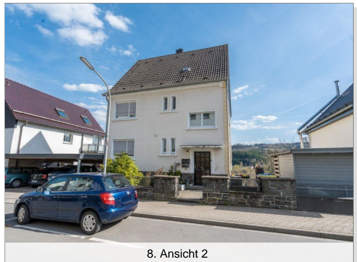
8. Ansicht 2