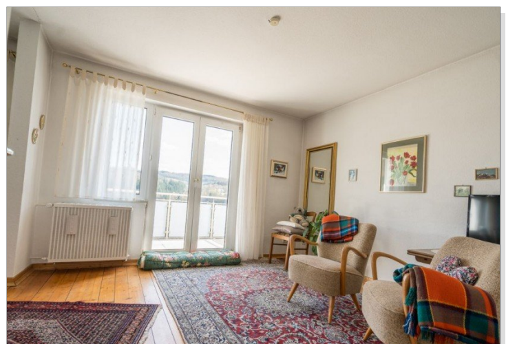
15. Großes Wohnzimmer mit Essbereich