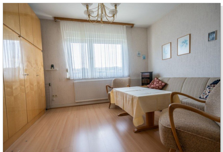
21. Schlafzimmer 1OG