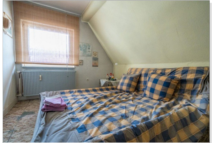
25. Zimmer DG