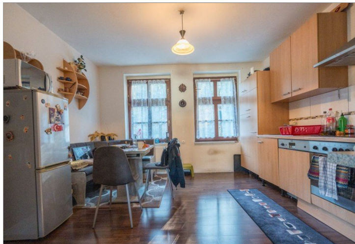
10. OG Kueche