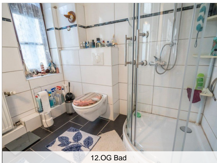
12. OG Bad