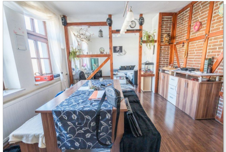
08. OG WohnEssbereich