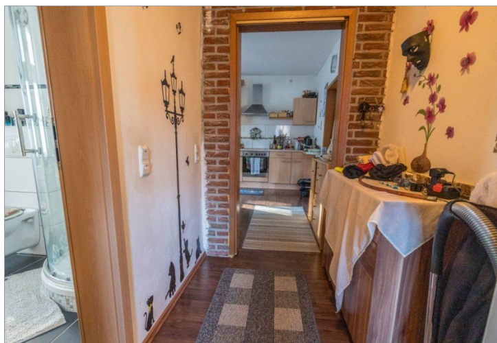
11. OG Diele